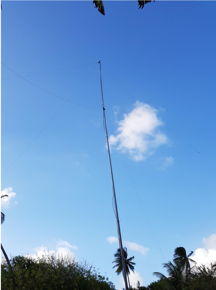
Мачта с антеннами на 40, 20 и ниже 30 метров.