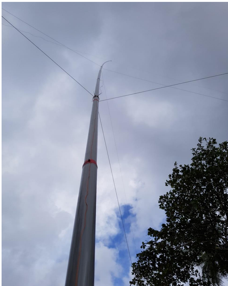
Вертикал на 160.

Посмотрите несколько фото наших антенн и мы продолжим рассказ.